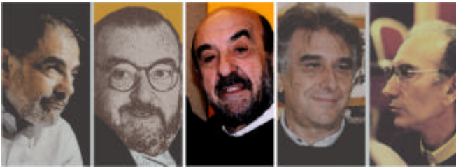
Imagen y Vestuario